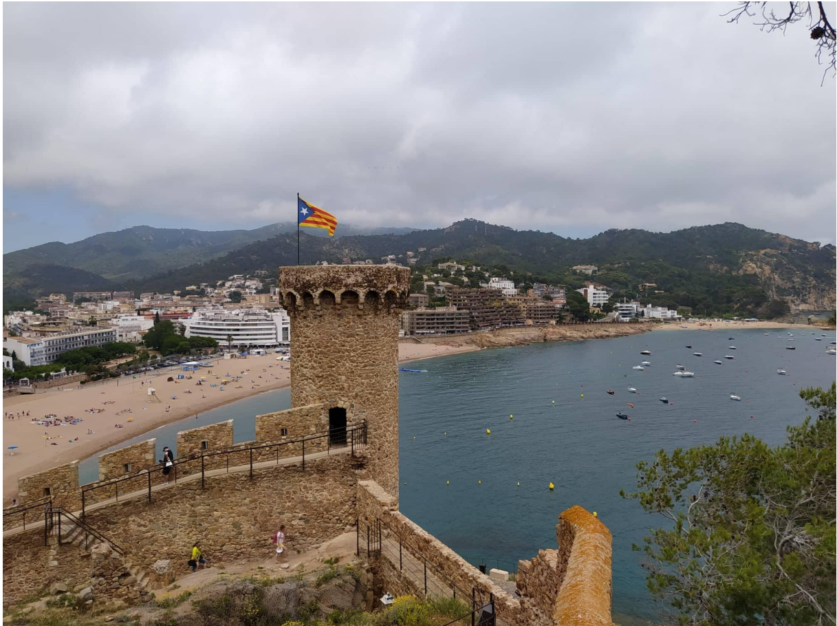
Tossa de Mar - Spanyolország