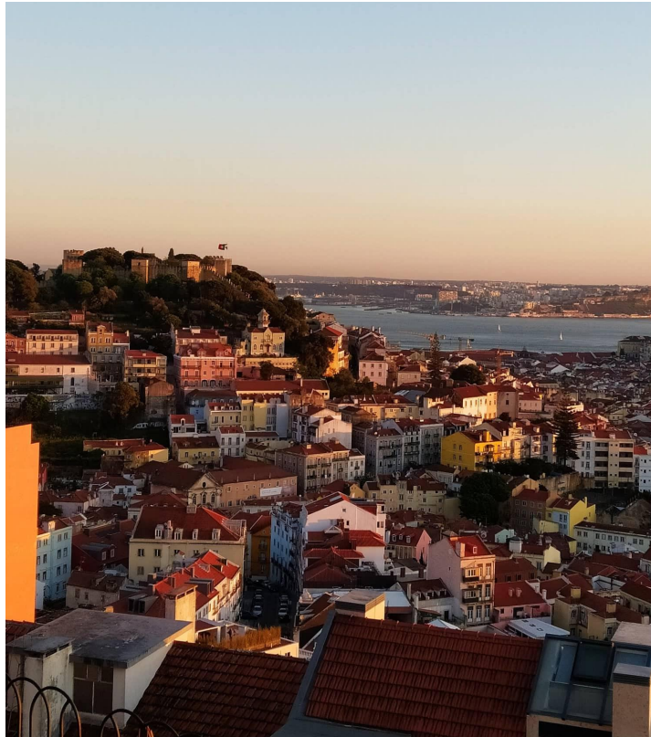
Lisabon - Portugália