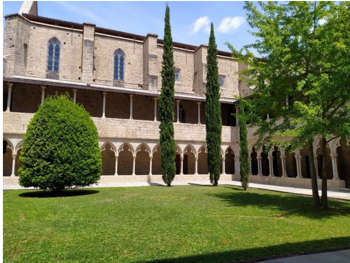
Barri Vell campusi épület belső udvara

szintén lehetett három kreditet szerezni. Az oktatók nagyon segítőkészek voltak, és az elvárások is korrektek voltak, továbbá az is egy nagyon nagy pozitívum volt a számomra, hogy nem tartottak katalógust, viszont ez csak az én szakomon volt jellemző. Az egyetemnek több campusa van, melyek szét vannak szórva a városban, én a Montilivi campuson voltam, ami viszonylag modern és a sportlétesítmények mellett található, viszont az óvárosi Barri Vell campus párját ritkítja.