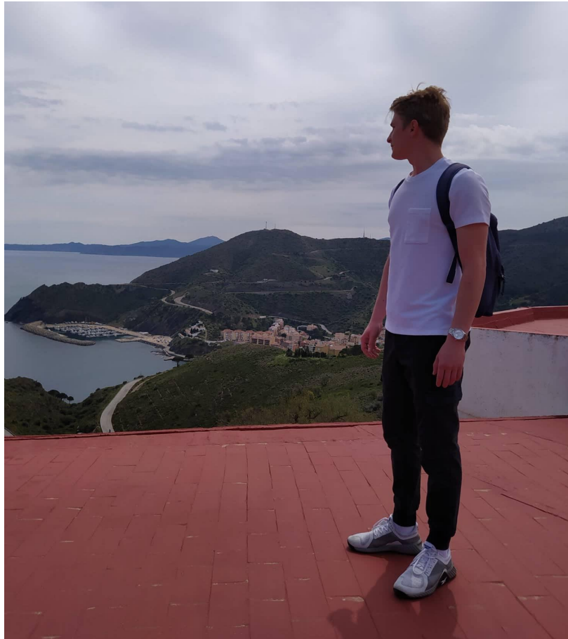
Cerbère-nél a spanyol-francia határon