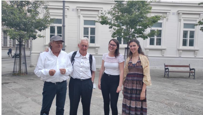
Találkozás furulyaművészekkel: Kees Boeke és Walter van Hauwe társaságában koncertjük után

után pedig pár szót válthattunk is velük. Nem gondoltam volna, hogy így összekötődnek az otthoni gyakorlatban lévő könyvek szerzői az Erasmus programmal. De úgy tűnik ide kellett jönnöm ahhoz, hogy többek között velük is találkozzak.