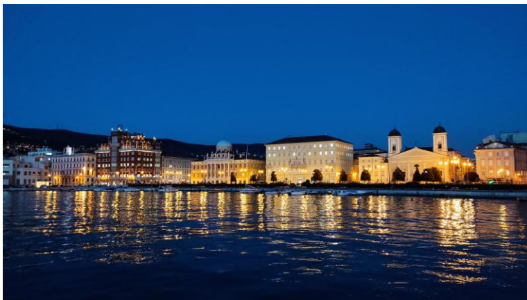
Esti városi fények