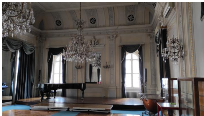
A konzervatórium díszterme

Pár hét elteltével már öröm volt belépni az iskolába és tapasztalni, hogy megismernek a portán, név szerint üdvözlnek és már ismerős helyként tekintetem körbe az épületben. Kezdem megismerni a tanárokat, diákokat és szívesen mondanám, hogy szépen lassan összeállt az órarendem is, de mindig hétről hétre változtak az órák időpontjai. Olaszországban élve megtapasztalhattam azt a bizonyos „Dolce vita” érzést, amikor elég, ha a napi teendőidet látod magad előtt és emellett pedig mindig van idő egy kávéra, sétára és szórakozásra.