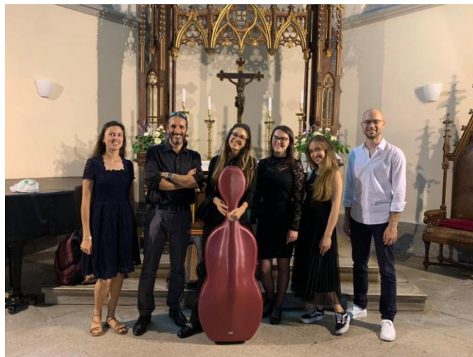
Hangversenyünk utáni kép a Chiesa Lutherana-ban

Kezdetben Trieszt tartománya piros zónából indult a vilá járványt tekintve, de a későbbiekben haladtunk az enyhítések felé és egyre több óránk lehetett élőben, a kezdeti félig online és félig élőben tartandó órákhoz képest. Júniusban került megrendezésre az első hangversenyünk a Chiesa Lutherana-ban egy koncertsorozat keretein belül. Ezen alkalomból adtuk elő azokat a műveket, amiket az órákon, a régizene együttesel is tanultunk. Nagyon jó élmény volt számomra, hogy más országokból érkező diákokkal együtt játszhattam. Bármilyen nyelvet is beszélünk, a zene nyelve mindig egy lesz a nemzetek között is. Nagy megtiszteltetés volt számomra az is, hogy a tanárommal együtt is felléphettünk ezen a hangversenyen, hiszen mindig különleges élmény a tanárokkal való együtt zenélés.