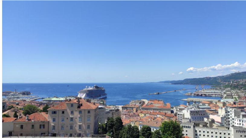
Panoráma a San Giusto Castello-ból