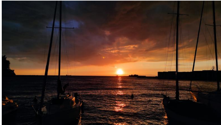
Naplemente a kikötőben

velem egy új országban, városban, iskolában ahol semmit és senkit sem ismerek. De a végén rájössz, hogy mennyit erősödtél és mennyire határozottá váltál. Azt gondolom, ezek a szituációk kellene ahhoz, hogy a jövőben is merjek belevágni és megvalósítani az elképzeléseimet. Sose gondold azt, hogy te nem vagy elég jó, vagy nem tudnád ezt végigcsinálni, hidd el, mindig lesznek körülötted olyan emberek, akik támogatnak a döntéseidben és a legfontosabb, hogy bízz magadban!