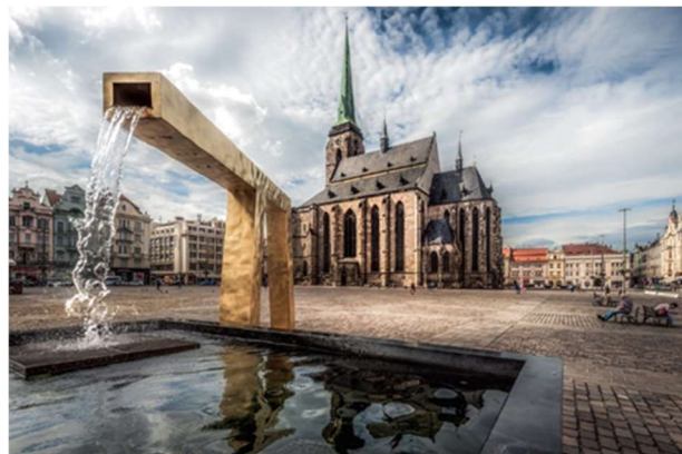
Pilseni főtér és a Szent Bertalan katedrális

A város nagyon szép, és tele van a tipikus cseh építészetre jellemző színes és díszes házakkal. Két hatalmas parkja is van, az egyik a város végén, míg a másik a városközpont közelében helyezkedik el. A város végi parkban rengeteg tó található, szalonnasütéshez kialakított helyekkel, kisebb büfékkel, és röplabda pályákkal.