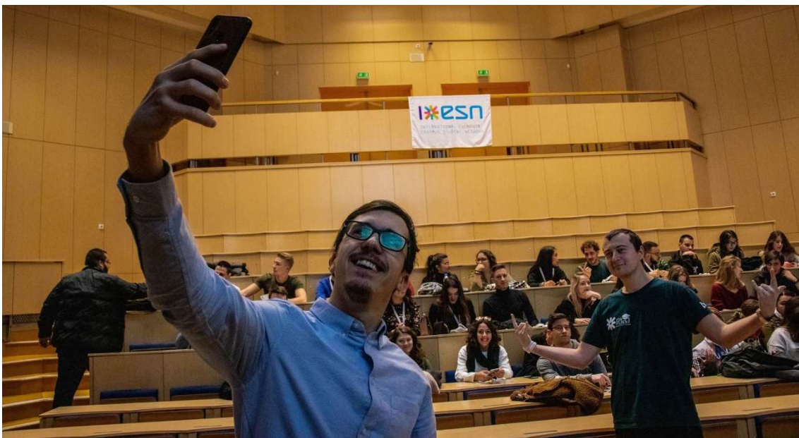
Az első ESN-es program, az első találkozás a többi diákkal

Az itteni ESN eleinte jó néhány programot szervezett nekünk, hogy jobban megismerjük egymást, így az első 3 hétben néhány óra alváson kívül nem sok időt töltöttem a kollégiumban. Szerveztek nekünk Welcome Week-et, ahol Welcome Pack-et kaptunk minden szükséges dologgal tele (egyetemi póló, notesz, pendrive, ESN kártya, cseh telefonkártya, stb.), körbe vezettek minket az egyetemen és a városban, ahol megmutattak mindent, amit szükséges tudnunk és ismernünk, az estéket a diákkocsmában, vagy éppen bárókban és szórakozóhelyeken töltöttük.