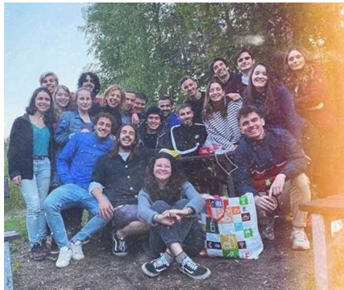
A barbecue party-s csapat

Amikor elkezdték végül csökkenteni a szigorításokat és már a szabadban is lehetett közös programokat csinálni, akkor rengeteg röplabdázással egybekötött barbecue party-t rendeztünk a közeli parkban, mivel itt a szalonnasütésre kialakított hely mellett volt egy röplabda pálya is.