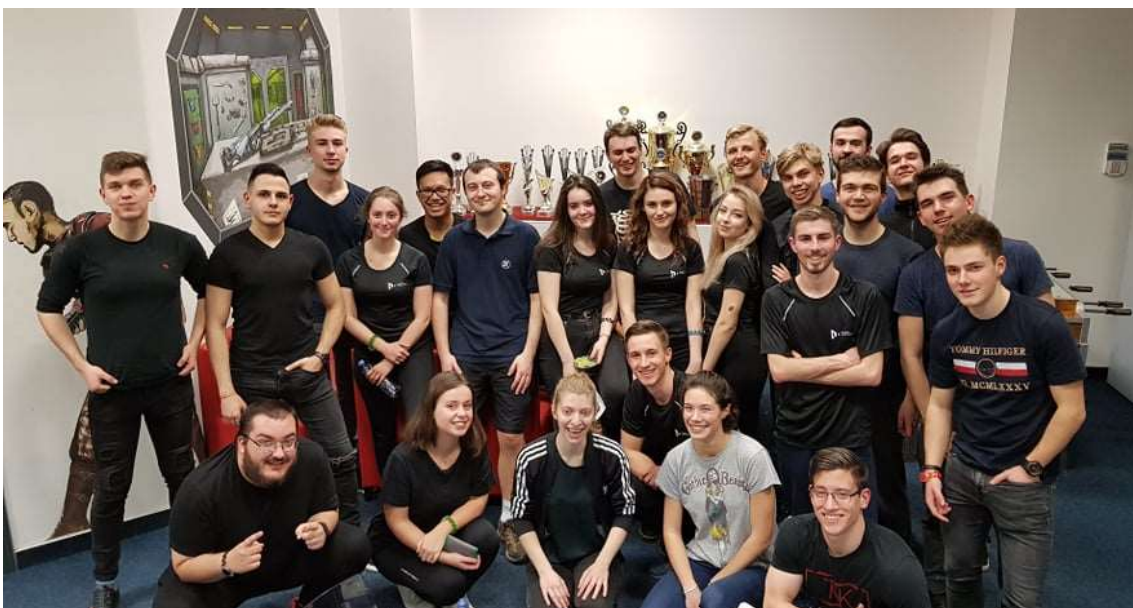
Laser Game egy kicsit szűkebb csapattal

A mentorok is nagyon aktívak, rengeteg programot szerveznek külön a saját mentoráltjaiknak, illetve azoknak a diákoknak, akiket ők is kedvelnek. Mindegyikőjük nagyon segítőkész, és próbálják minél jobban összekovácsolni a csapatot.