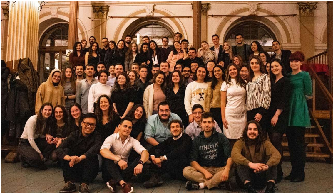
Welcome Dinner az Erasmusos csapattal