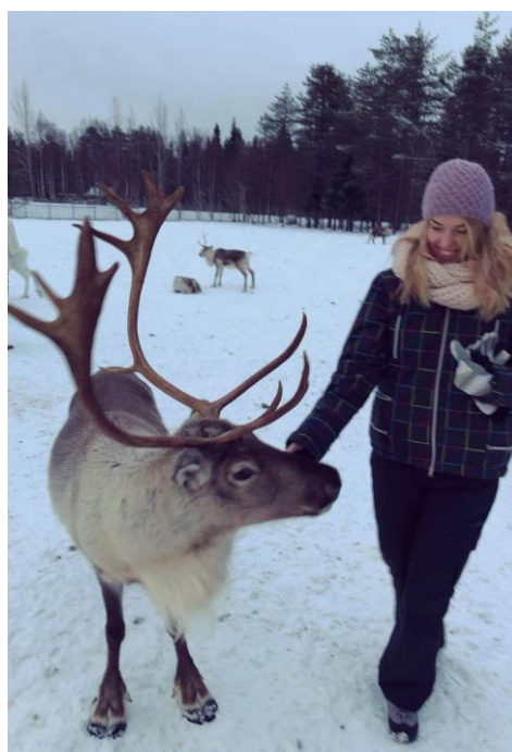
Rénszarvas simogatás Lappföldön