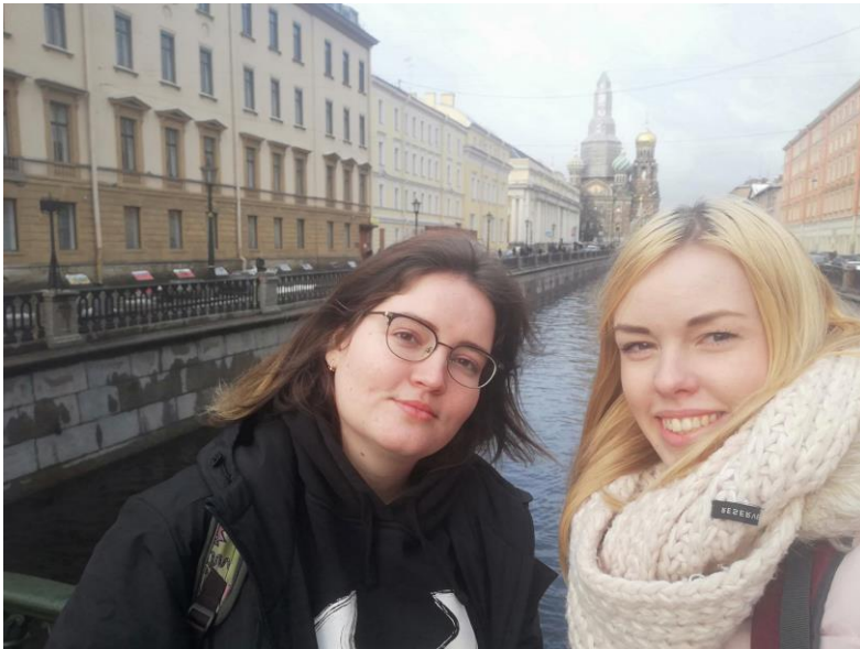
Szentpéterváron a Tamperében megismert orosz barátnőmmel