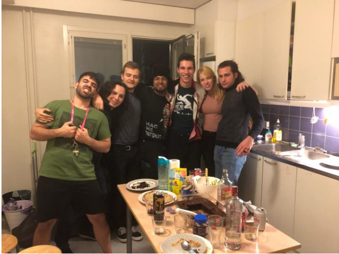
Vacsoraest a barátokkal