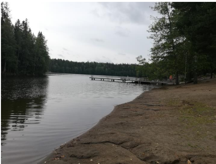
Suolijärvi – kedvenc tavam az egyetem mellett